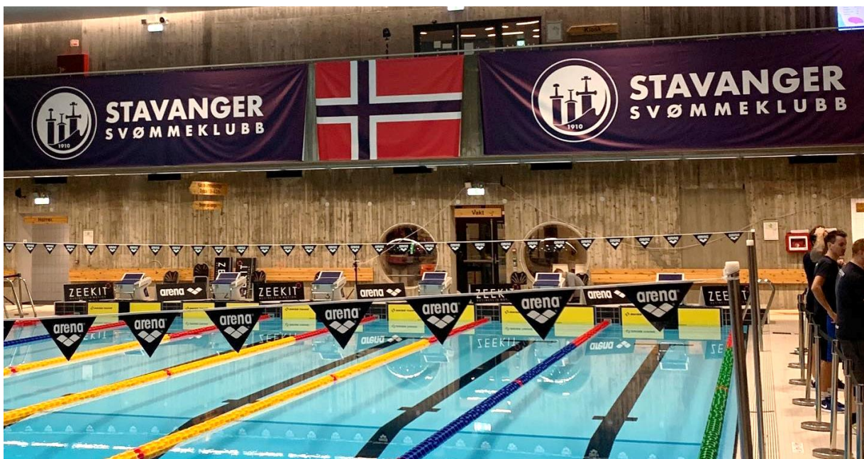
Foto: Stevneutvalget deltok i komiteen som arrangerte NM Kortbane i Stavanger Svømmehall 17. – 20.11.2022.